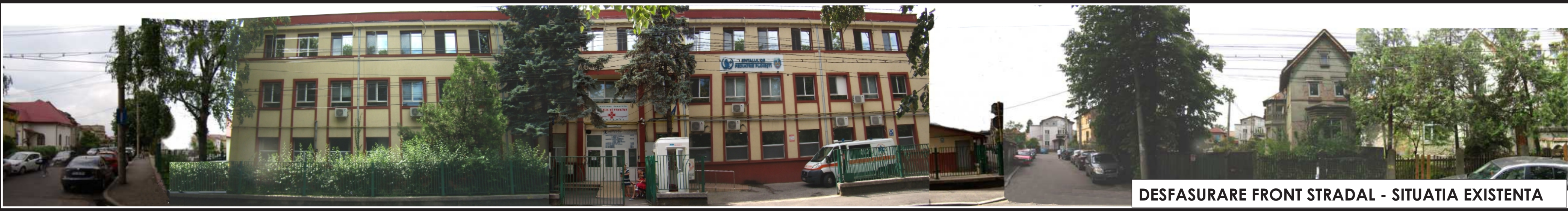
DESFASURARE FRONT STRADAL - SITUATIA EXISTENTA