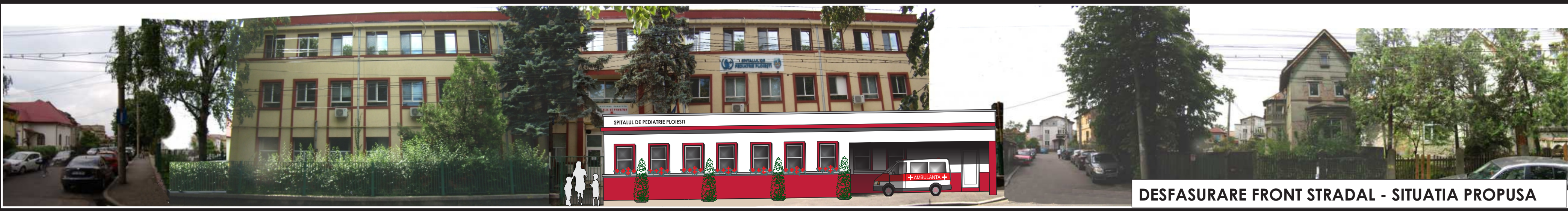
DESFASURARE FRONT STRADAL - SITUATIA PROPUSA